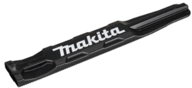
413L91-8 Transportbescherming 500mm