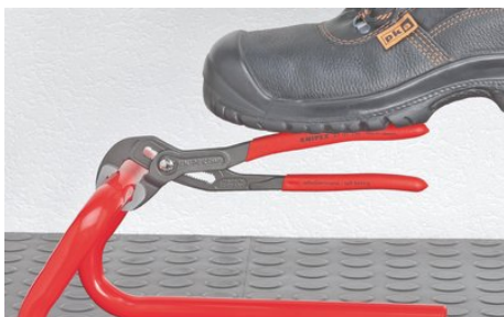
Tegen de draairichting in verzette tanden zorgen voor een zelfklemmend effect en verhinderen wegglijden aan het werkstuk