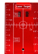
LE00758831 Laserrichtplaat rood kruislijnlasers