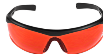
LE00834534 Laserlijns bril rood