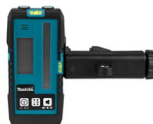
LE00855702 Laserlijns ontvanger LDX1