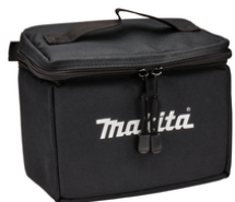
LE00929103 Multilijnlasers tas