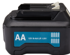
CP00000001 ADP09 Batterij adapter lasers