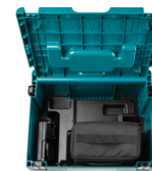
8351P4-9 Kofferinzet/inlay SK700