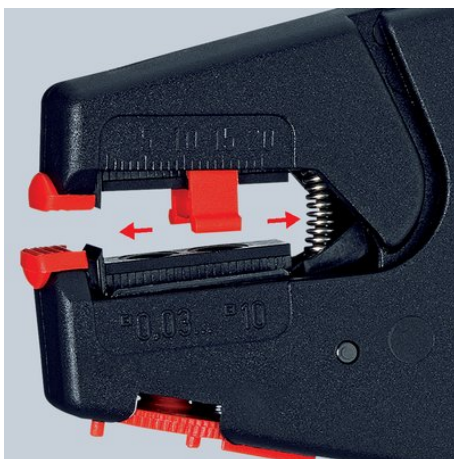
12 40 200: Verstelbare lengteaanslag

Onder voorbehoud van technische wijzigingen en vergissingen