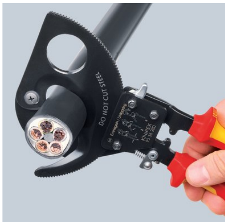
Ratelpincipe en tandkransaandrijving met twee gangen om te snijden met minder kracht