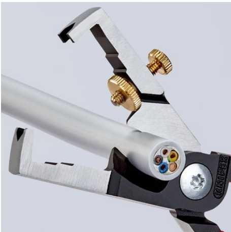
Inductief gerhard schaarlemmet, precisiegesteep, voor het knelvrij snijden van koperkabels tot \varnothing 15 mm ( 5 \times 2,5 mm 2 )